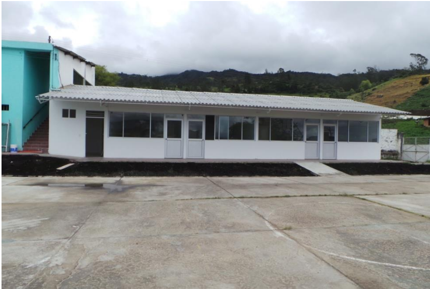
CBA SAN JOSE EN CHIPAQUE Adecuación dormitorio mujeres