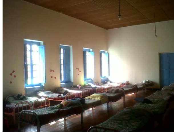
Pintura general en Instituto Campestre-Sibaté