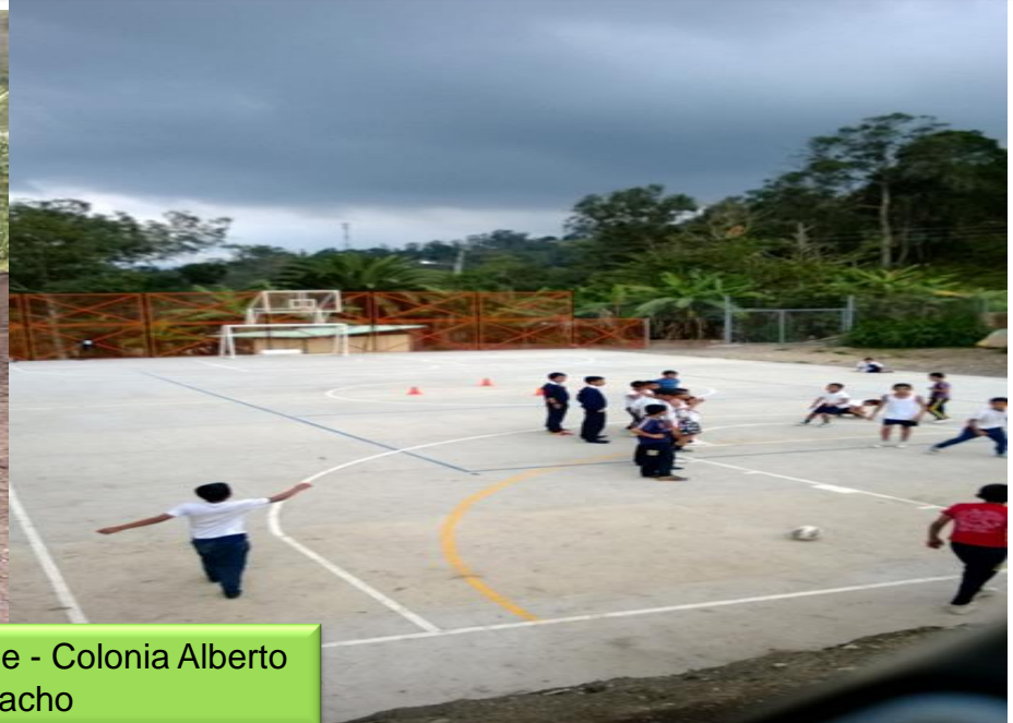
Construcción cancha múltiple - Colonia Alberto Nieto Cano- Pacho